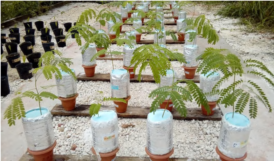
Figura 2 – Imagem das plantas jovens de ( Schizolobium amazonicum Ex Duck), utilizadas no experimento.

painéis aglomerados (IWAKIRI et al., 2010), suas fibras é utilizada pela empresa Rio Concrem em parte da composição de chapas MDF. Além da produção de pasta celulósica. Como produto não madeireiro, a casca do paricá é utilizada com fins medicinais para o combate de diarreia e hemorragia uterina (CARVALHO, 2007).