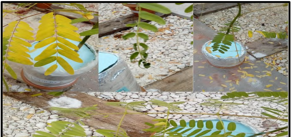
Figura 5 – Sinais de toxidez por cádmio nas mudas de paricá

Após 15 dias da aplicação do cádmio com sinais de toxidez (clorose, epinastia, senescência foliar) – (Figura 5) foram coletadas para análise bioquímicas, as mudas foram separadas em folha, caule e raiz, os três órgãos foram armazenados em sacos de papéis e levados à estufa de ventilação de ar forçada a 65°C por 48 h. Após a secagem as partes foram moída em moinho tipo Wiley, sendo devidamente armazenado em tubos de falcon. Parte do material seco foi levado para a Museu paraense Emílio Goeldi para análise da concentração de cádmio.