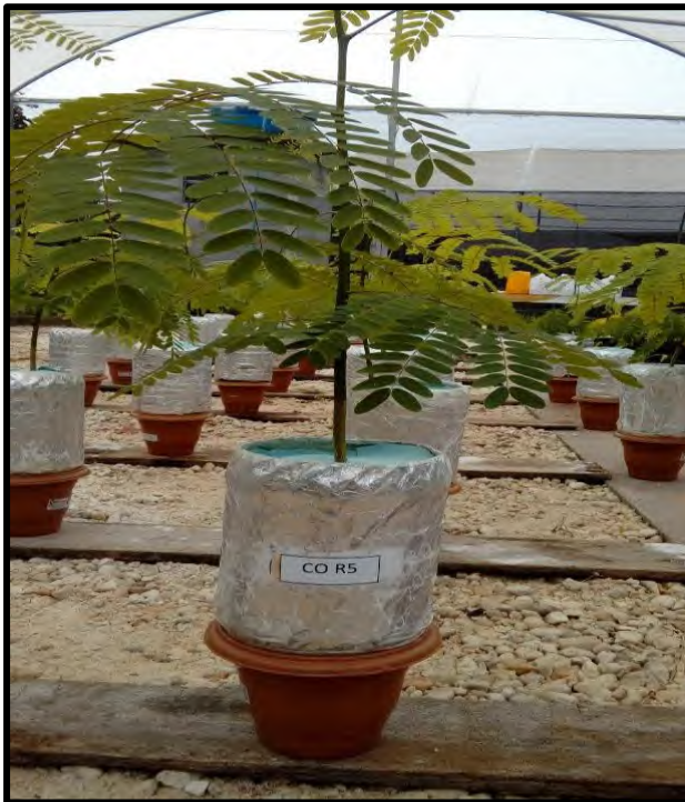
Figura 4 - Vasos adaptados tipo leonard usados no experimento