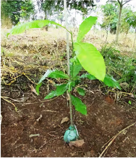
Figura 2. Muda de castanheira plantada com o uso de protetor feito de garrafa PET.

A adubação de plantio para todos os tratamentos consistiu de uma mistura de 300g de superfosfato simples e uma pá de esterco bovino curtido, este composto orgânico contém em média 57% de matéria orgânica, 1,7% de nitrogênio, 0,9% de P_2O_5 e 1,4% de K_2O (Ribeiro et al. 1999). Após o plantio foi feita adubação por cobertura com 260 g de NPK 4-14-8 dividido em três aplicações: 60 g aos 15 dias, 100g aos 45 dias e 100 g aos 90 dias. Foi também utilizada a aplicação de hidrogel na cova de plantio, na profundidade de 30-40cm, na dosagem de 5 g/2 litros de água limpa.