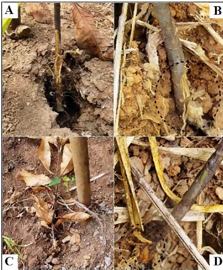
Figura 3. Danos ocasionados por roedores em mudas de castanheira no tratamento 1. A: cova escavada por roedor para predação do endosperma. B: muda com endosperma consumido por roedor. C: muda morta pela predação de roedor. D: muda ainda viva com endosperma consumido parcialmente.

O ataque de roedores consistiu na escavação das covas das mudas até a profundidade na qual encontrava-se o endosperma, consumindo-o total ou parcialmente e conseqüentemente levando a planta à morte (Figura 3).